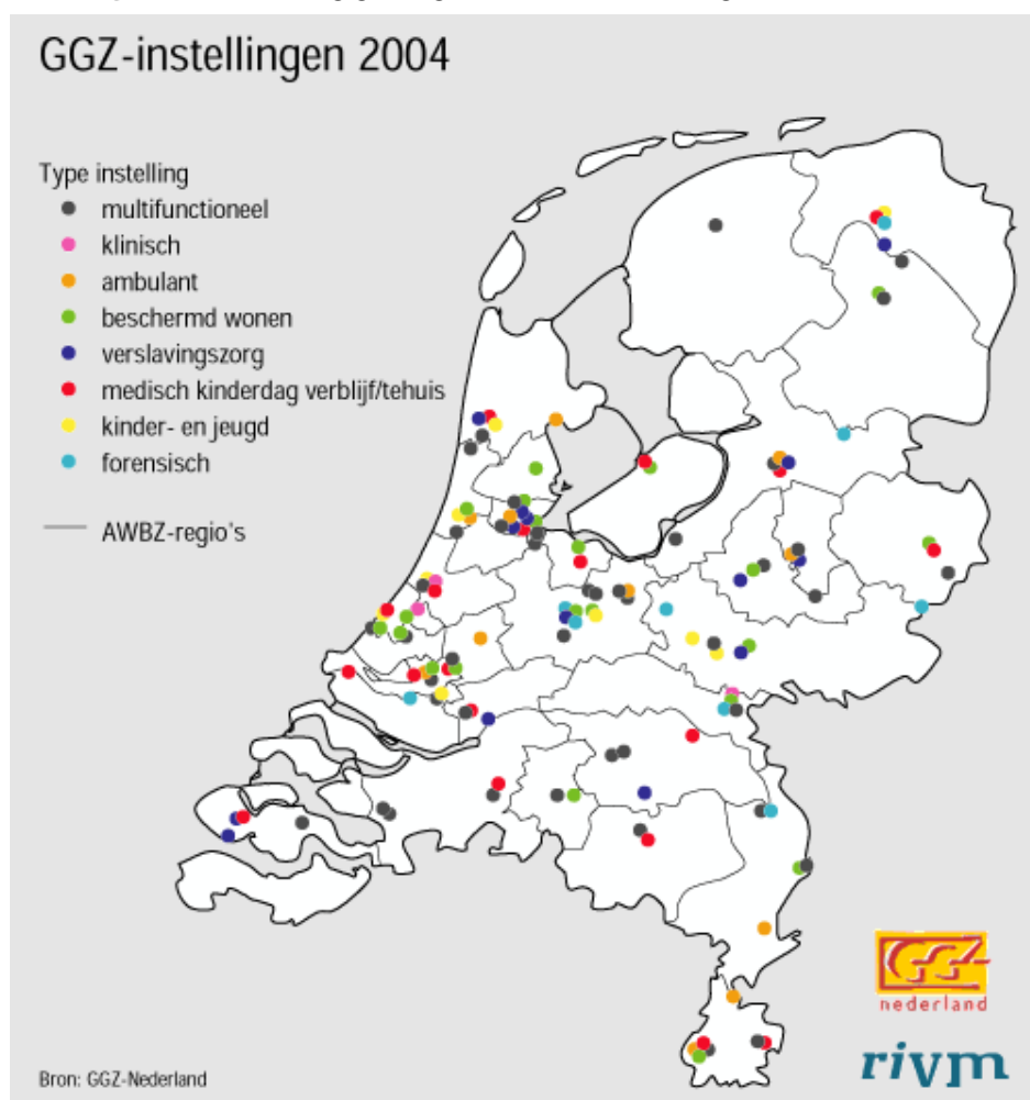
Figuur 1: Verdeling geïntegreerde GGZ-instellingen over Nederland

Een sterke onderhandelingspartner aan de inkoopkant stuit doorgaans op weinig mededingingsbezwaren als daar een sterke machtspositie aan de aanbodzijde tegenover staat (NMa 2004b, randnummer 47). Eenzijdige uitbuiting van inkoopmacht is dan immers niet goed mogelijk. De GGZ kenmerkt zich door een hoge marktconcentratie aan de aanbodzijde (VWS, 2002). De afgelopen jaren is er in Nederland bewust beleid gevoerd om in de GGZ de ontwikkeling van grootschalige regionale zorgaanbieders te stimuleren. In de Beleidsvisie geestelijke gezondheidszorg die in 1998 door de toenmalige minister van VWS Borst naar de Tweede Kamer is gezonden, staat dat de RIAGG's en psychiatrische ziekenhuizen dienen op te gaan in regionale GGZ-instellingen (Tweede Kamer, 1998). Als gevolg van de fusiegolf die heeft plaatsgevonden, is sprake van een sterk geconcentreerde markt (zie figuur 1). 23